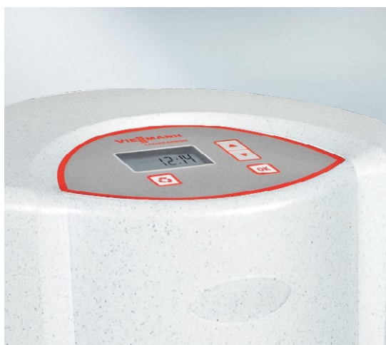
Elektryczny panel dotykowy filtra Aquacarbon zapewnia łatwą i komfortową obsługę