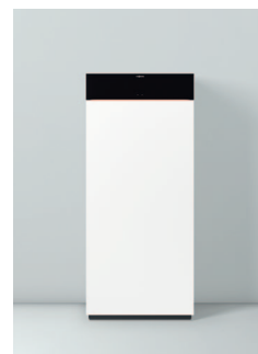
Vitodens 222-F, typ (B2TF)