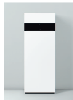
Vitodens 222-F, typ (B2SF)